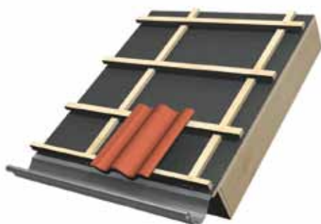
Traditionellt undertak av råspont, papp, ströläkt 25 x 25 mm och bärläkt 25 x 38 mm.

1. Kontrollera bärläktens kvalitet, hållfasthet och infästningspunkt.