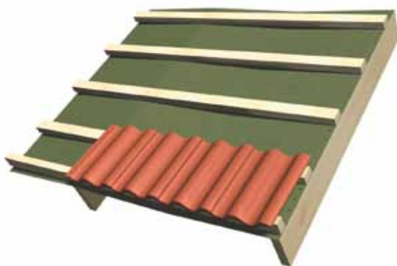
Lätt undertak med 45 x 70 mm läkt. Se till att undertaket har lite nedhäng mellan takstolarna..

2. Börja montage nerifrån. Bärläktstegets byglar häktas över takpannans överkant och under bärläkten. Taggade spröten förs in i underliggande steg.